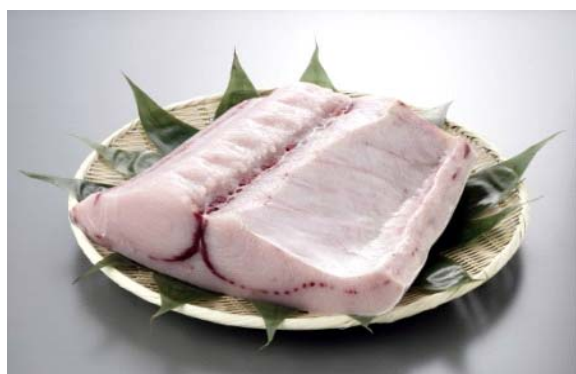
メカジキのブロック (販売時はサク取りしています)