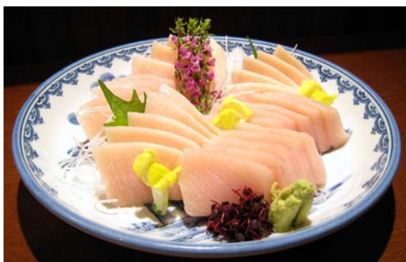
メカジキ刺身の盛り付け例