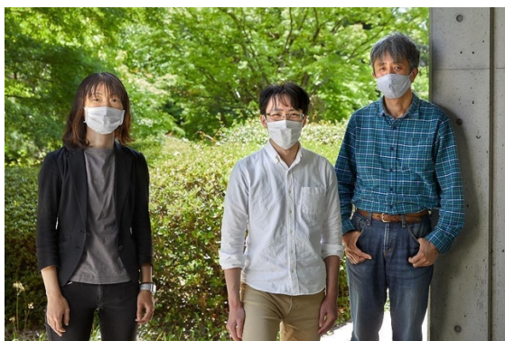
国立環境研究所の研究グループ