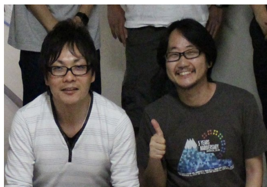
静岡大学の研究グループ