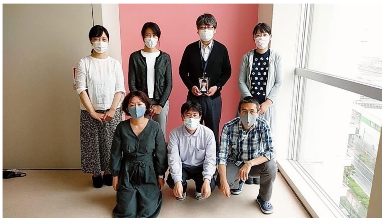
理研の研究グループ