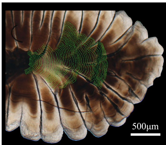
図. マアジ耳石の明瞭化した日周輪

本成果は、2022年7月29日に国際学術誌「Rapid Communications in Mass Spectrometry」に掲載されました。