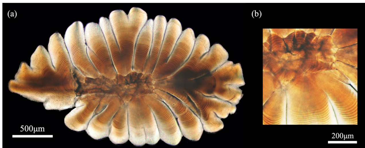
図1. マアジ耳石の顕微鏡写真 (a) と耳石中心部付近に確認できる稚魚期の日周輪 (b)

今回我々は、日周輪の成長幅がマイワシよりも数倍広いマアジの耳石（図1）を用いることで、1本ごとの日周輪に沿った切削手法を確立し、1日ごとの \delta^{18}\text{O} 履歴（=経験水温履歴）を解明することを目指しました。