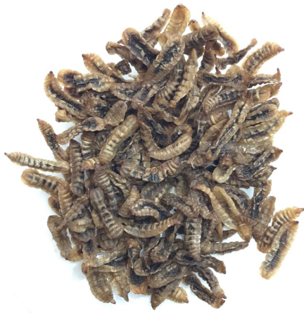
乾燥ミズアブ幼虫

れる摂餌性や行動、体色などへの負の影響はミズアブ粉半分代替飼料区において確認されませんでした。