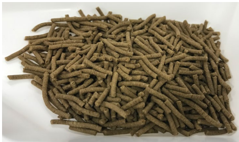
ミズアブ粉を配合した飼料