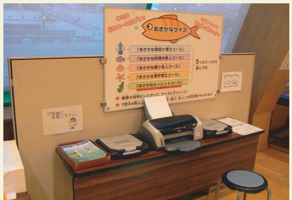
おさかなクイズもあるよ！