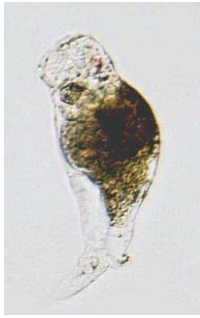
図3 メガネモチノウオの初期餌料 Proales similis 。Bar : 50 \mu\text{m} 。