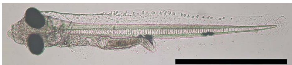
図 2 プロアレスを摂餌したメガネモチノウオ仔魚（4 日齢、Bar : 1mm）。

これまでメガネモチノウオについては漁業のみが行われてきましたが、今回の研究で、高値で取引される本種の養殖を進める上で必要不可欠な種苗の供給へつながる成果が得られました。今後はこの成果を活用して種苗の安定生産技術の開発を進めていく予定です。