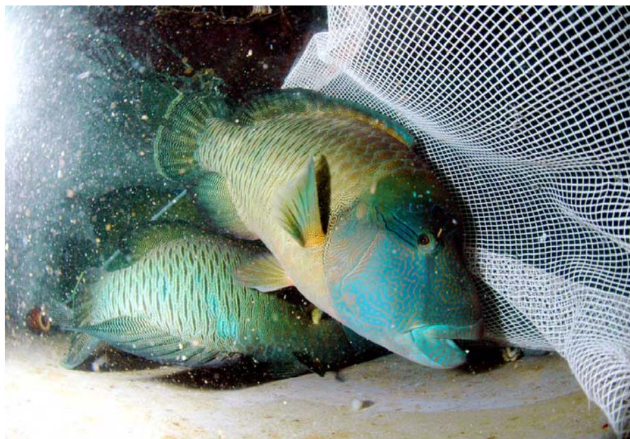
図1 メガネモチノウオ Cheilinus undulatus 養成親魚

このようなことから、新たな養殖対象種として期待される本種の種苗生産技術の開発が求められていました。